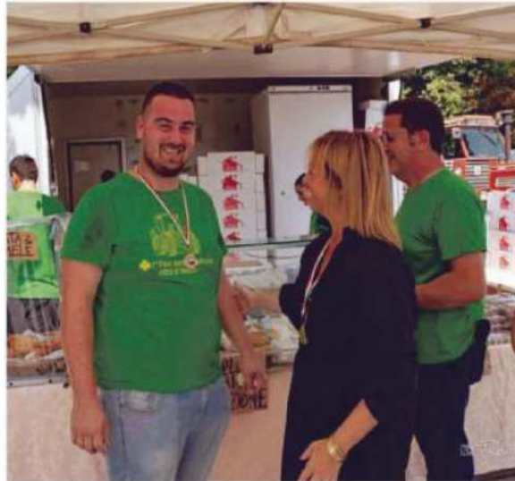
MOLTE AZIENDE AGRICOLE PORTERANNO I LORO PRODOTTI IN FIERA

mezzi a testimonianza dei mestieri di un tempo, fino ai recinti con gli animali della fattoria. Per finire in bellezza, anche la tradizionale sfilata dei trattori per le vie della città che si svolgerà domenica 3 settembre. Ad arricchire il tutto anche il grande mercato agricolo a Km zero, uno spazio in cui le aziende del territorio avranno la possibilità di mettere in mostra e in vendita i propri prodotti, derivati dalla produzione e dall'allevamento messi in pratica sul territorio.